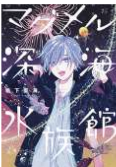
マグメル深海水族館 1～8 梶下聖海 新潮社

例えば、この2作品。深海生物、水産大学を題材にしたものです。この夏、一気に読みしてみませんか？