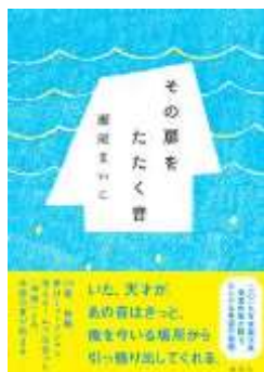
その扉をたたく音 瀬尾まいこ 集英社

コンクールは課題読書・自由読書の2部門で作品を募集しています。課題図書以外でも今までに読んで本の中で感動した、共感した、進路に大きな影響を与えた本との出会いを作文にしてみましょう。感動や発見を文字に起こすことで、自分の気持ちに向き合うことができ今後の進路活動にも役立ちます。