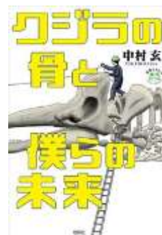
クジラの骨と僕らの未来 (世界をカエル10代からの羅針盤) 中村玄 理論社

10歳で建築家を志し、2020年東京オリンピック会場をてがけた建築家が綴る10代へのメッセージ。建築知識も満載。