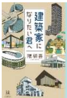
建築家になりたい君へ (14歳の世渡り術) 隈研吾 河出書房新社

29歳、無職。ミュージシャンの夢を捨てられない宮路は老人ホームで「神様」と出会う。人生の行き止まりから始まる感動の青春小説。