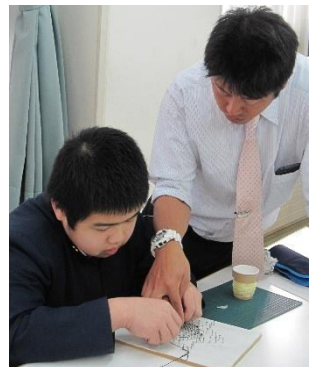
協力して 水高の校章を作成中

11月5日に鶴岡北高校にて2名の委員が参加してきました。今年の研修内容は「ストリングアート」。水高の校章、ヨットをデザインしていました。他校生や講師とも交流しながら、立体的な作品が出来上がりました。作品は新刊棚に展示しています。